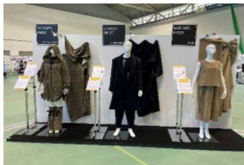
JTC2023 受賞作品 (左から準グランプリ・グランプリ・新人賞)