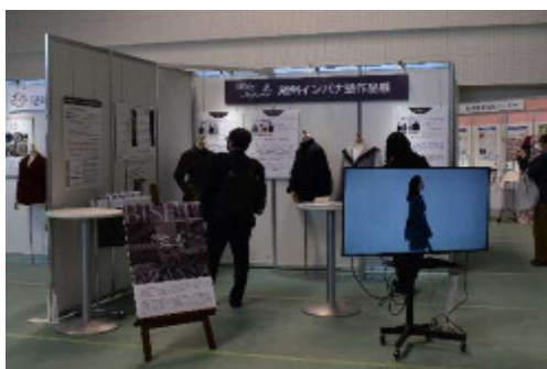
尾州インパナ塾作品展