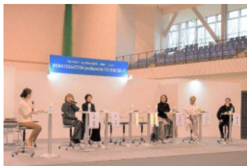
特別トークショーの様子