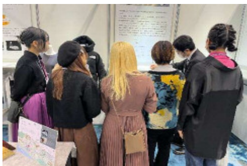
ヤーン・フェア学生入場の様子