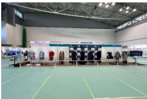
FDC 開館 40 周年記念イベント衣装展示 BISHU FES. 衣装展示