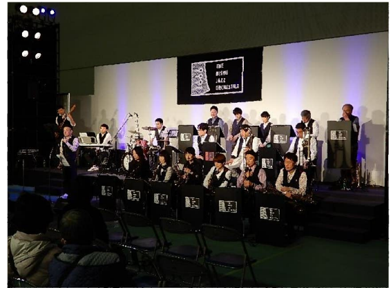
尾州ジャズオーケストラライブの様子