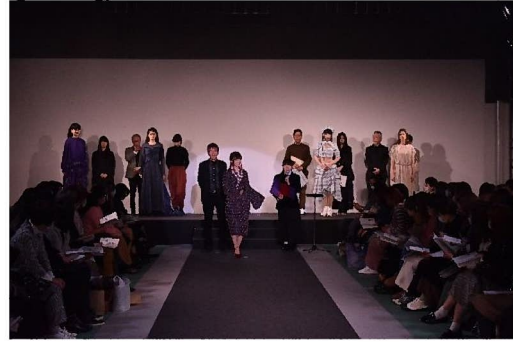
製作した学生が匠講師と登壇しプレゼン