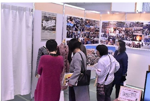
ツイードラン尾州展示