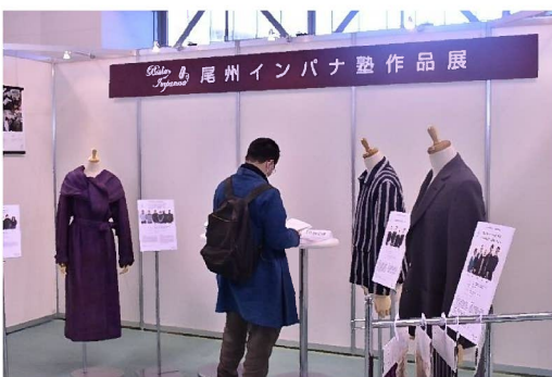
尾州インパナ塾作品展