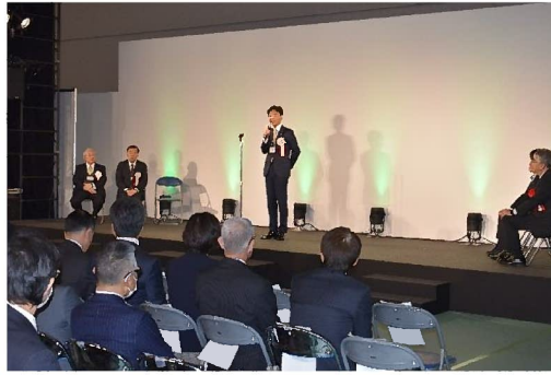
挨拶をする中野正康一宮市長

10時のオープンに先立ち、いちい信金アリーナ A に設置された特設ステージにて繊維団体関係者等 175 名が見守る中、中野正康一宮市長（FDC 理事長）が主催者を代表して挨拶をし、来賓として出席した杉浦宏美経済産業省製造産業局生活製品課長、西村美郎愛知県経済産業局技監が祝辞を述べた。