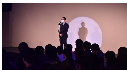
マスクであいさつをする事務局長