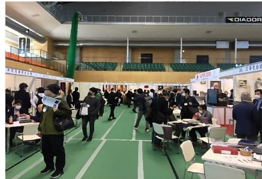
ジャパン・ヤーン・フェアの様子