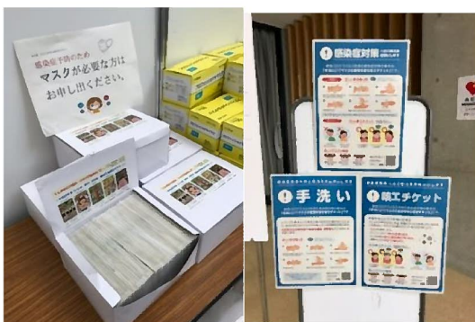
FDC が準備したマスクと案内看板