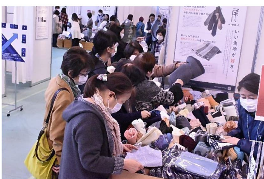
人が多い会場もほとんどの来場者がマスクを着用