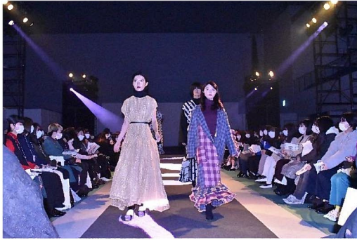
ガーメントを着たモデルがウォーキング