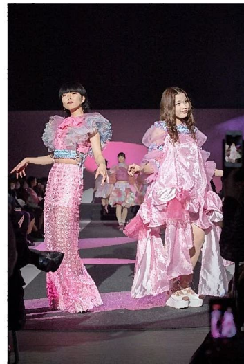
ファッションショーの様子