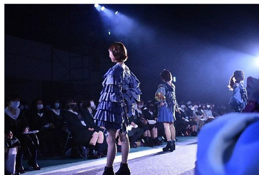
ビジョンズでは新型コロナウイルスの影響を考慮して、入場者全員にマスクの着用をお願いした