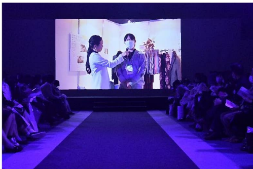
ファッションショー横には企業紹介ブースが設けられ、インタビュー形式で紹介される様子をスクリーンに映した