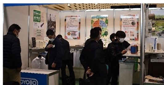
出展企業及び来場者も感染防止に積極的