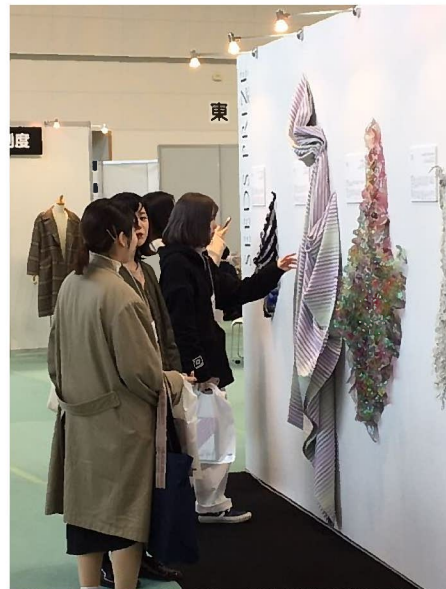
JTC2019 優秀作品展の様子