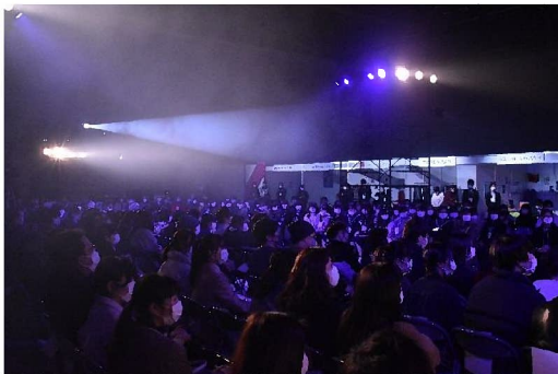
新型コロナウイルスの影響を考慮して、入場者全員にマスクの着用をお願いした

総合展で目玉イベントの1つとなる「ビジョンズ」。ファッション系の学校8校が共同でファッションショーを行ったほか、ファッションショーの合間に尾州の企業情報を学生に向けて紹介した。また、10校のファッション系学校を紹介する常設展示や、ハローワークブースにて就職情報コーナーを設置したほか、尾州で働く女性に焦点を当てた現場女子写真展を開催した。常設展示は延べ2,000人、ファッションショーには900人近い学生らが来場した。