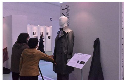
受賞作品を鑑賞する来場者