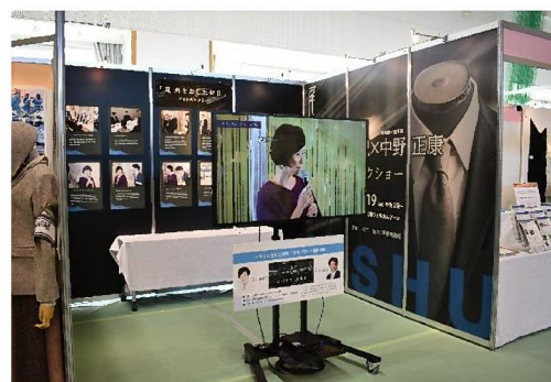
「尾州をたしなむ日」写真展