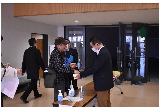
マスク配布の様子