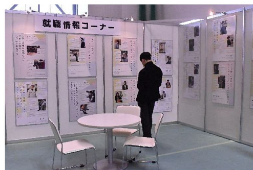
就職情報コーナー