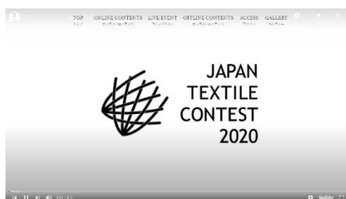
会場モニター及びオンライン上で放映