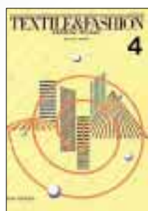
Vol.6/ No.1~No.12 (1989年4月~1990年3月)