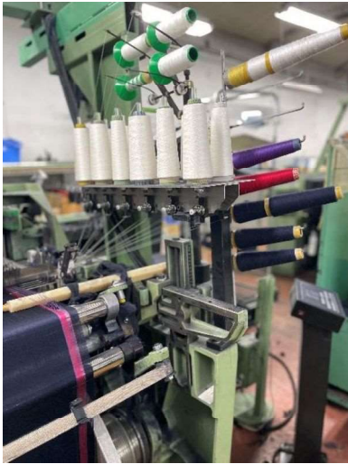
・・・インターンシップ・・・

受講生の方々は勤務先（紡績・染色・織物・ニット）・職種、そして経験年数が非常にバラエティに富んでいます。繊維業界の異業種交流とも呼ばれ、各自が積極的に、かつ自由に学ぶ事ができます。