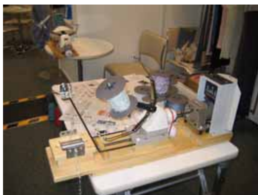
{ 意匠燃糸を作るミニプラント }