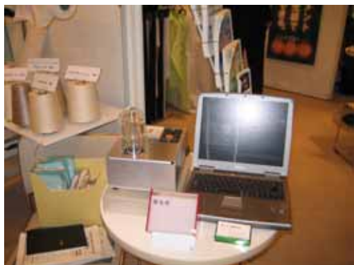
{ 多機能繊維の紡糸デモ機 }